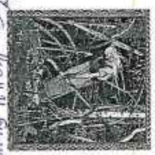
1. "Страшный суд" М. Микеланджело.

Напишите названия картин и их авторов. Какие явления и события будущего предвсказали эти художники? (5 баллов)