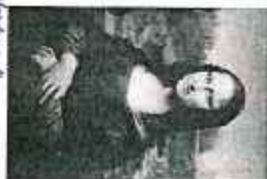
3. Мона Лиза